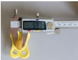
hier ist der Schaft schmaler

Das Lutschteil sollte weich und beweglich sein , damit die Zunge möglichst wenig in der Bewegung behindert wird: