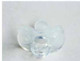
Silikon, da dies unbeweglicher ist

Der Schnuller benötigt keine besondere Auflage für den Kiefer , da die Zunge damit in der Beweglichkeit eingeschränkt wird: