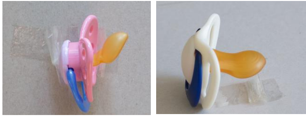
Abschrägung ist ungünstig

Der Schnuller sollte nicht abgeschrägt sondern symmetrisch (oben und unten leicht gerundet) sein, da die Zunge sonst nach innen gedrückt werden kann: